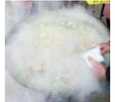
すべて江田島産の素材で 地産地消♪あったかいお汁!!